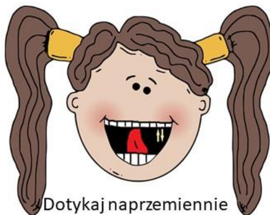
Dotykaj naprzemiennie górných i dolnych zębów