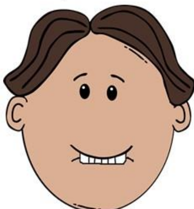
Nagryzaj zębami wargę