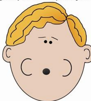
Zrób balon z buzi